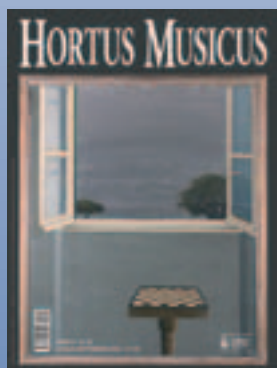
Sandro Luporini, Interno-esterno n. 2 (2003)