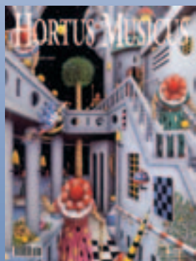
Pier Augusto Breccia, Immaginazione e Potere (1998), part.