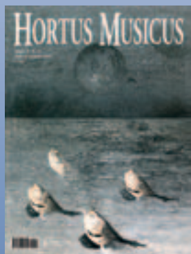
Sandro Luporini, Pesci che muoiono n. 1 (1969)